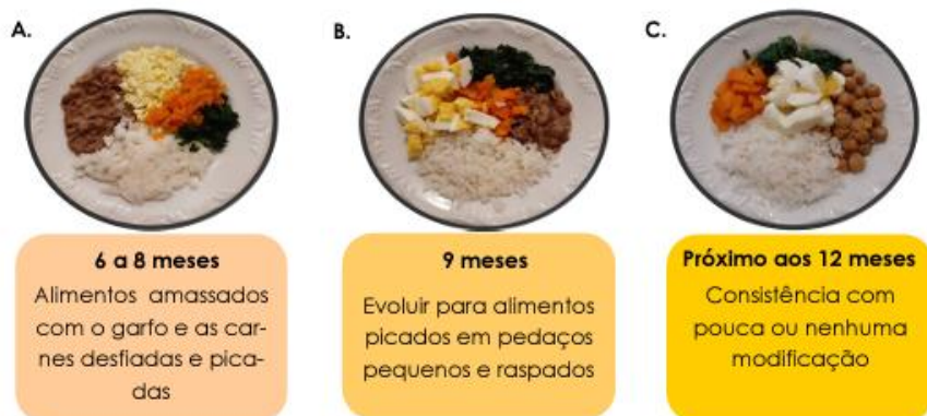
Figura 1. Evolução da consistência das preparações

Lembre-se! Amassar com o garfo cada vez menos para evoluir a consistência